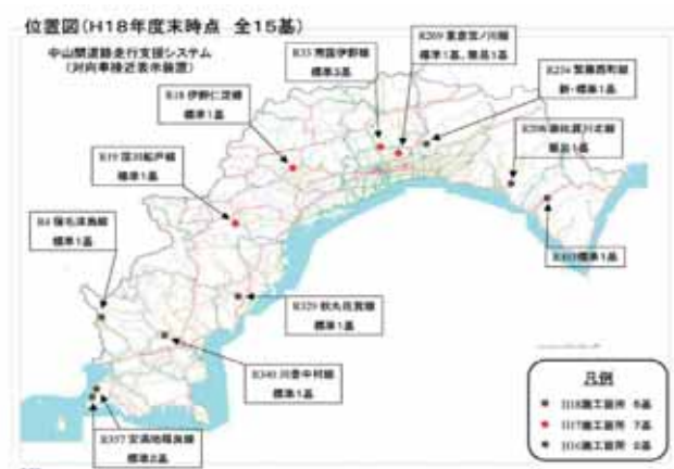
図 2 設置位置図