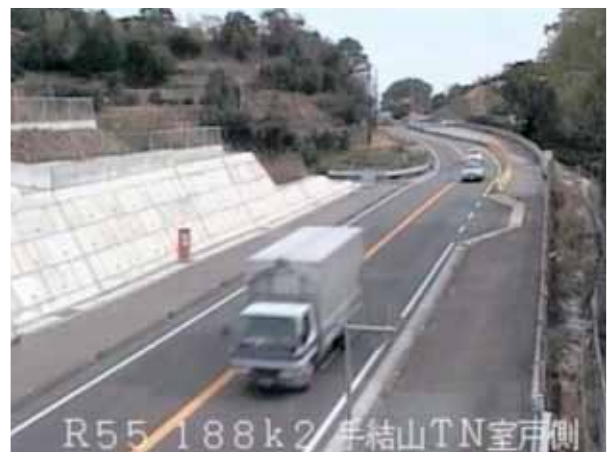
図9 上流（左）及び下流（右）地点の画像

呼称はどうか道路交通社会に於ける情報は更に不可欠で発展すると考えられる。国が推し進める e-Japan 政策のなかで ITS は重要な位置づけとして挙げられている。平成16年に定められた IT 新改革戦略 (New IT Reform Strategy in 2006) の中で「世界一安全な道路交通社会の実現」を目指し、「2012年末に交通事故死者5000人以下を達成する」と具体的な目標も定められている。その中で地域からの発信は重要と実感している。高知は色々な面でハンディを背負っていると言える。しかし、Late-comer Benefitsという言葉もあるように、遅れているが故に有利な面もある。例えば、先行者の辿った回り道避け最短ルートで行ける、或いは失敗を避ける、更に改良出来る等々である。マイナス面をプラスに考える発想が ITS も必要と考えている。例えば、高齢化、過疎化は高知の現在の喫緊の課題であるが、日本の10年先を先取りしていると考えられる。高知でこの問題を解決できれば、Late-comer から Front-runner となりえる。微力ながら、高知から全国へ、更に世界へと羽ばたきたいと考えている。そして、その際の我々の