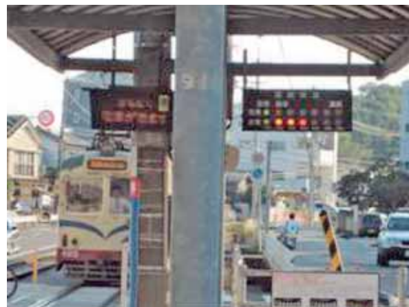
図7 情報提供実験の風景

高知の路面電車は後乗り前降り方式であり、混雑した車内では後方から前方まで移動し、料金を支払うまでに時間を要する。これにより利用者に不便を強いるばかりか運行に遅延が生じ、