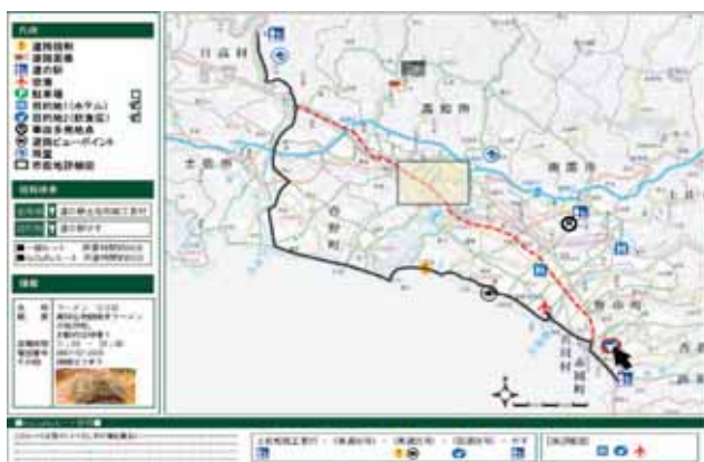
図5 KoCoRoマップイメージ図

今後は平成19年4月以降における実験運用を通じて、利用者効果、運営モデルの評価を行い、継続的な実運用への移行を検討していく予定である。