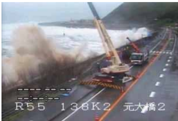
図8 越波発生時の画像

CCTV (Closed Circuit Television) とは、道路管理者である国土交通省が越波や落石と言った危険箇所に設置している道路監視システムである。土佐国道事務所管内では現在207台の CCTV カメラが設置されているが、その目的ゆえに日常時の映像データはほとんど利用されていない。本研究では、既存 CCTV の有効活用方法の検討を行い、以下の応用方法を提案し、そのシステム構築を目標に研究を行った。越波検出は、越波の速度が速い特徴を考慮し、時間差分とよばれる画像処理を微小な時間差で行い越波検出を試み、実際の越波画像を用いた評価を行い、検出に成功した。地点間旅行時間計測は、地方の国道の多くは片側1車線の対面通行区間が多いことと、都市間での流入出が少ない特徴を利用し、地点間での車両の特徴とその順列をマッ