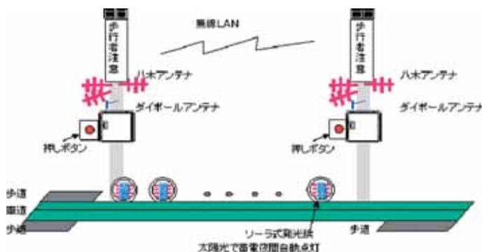
図3 中山間歩行者注意喚起システム概要

中山間地域では少子高齢化、過疎化の影響から通学児童が減少しており、投資効果などから都市部での歩道整備が優先され、中山間地域での歩道整備はますます困難な状況にある。しかしながら、中山間地域においても通学児童等の道路利用者の安全確保は急務な状況である。そこで高知県と共同でこれらの地域を登校する通