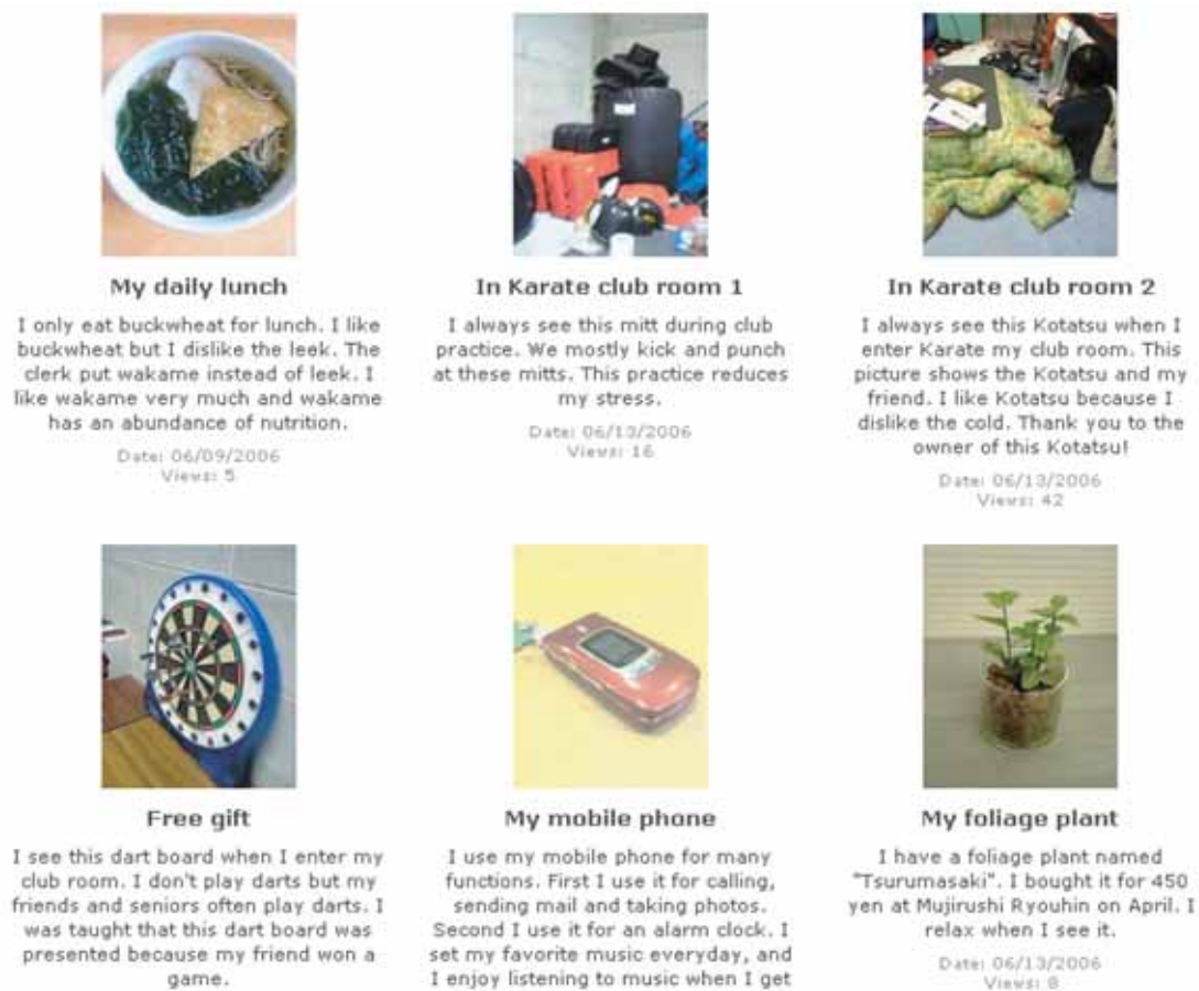
Figure 3 : Example mobile blog post

Tech-savvy educators have been waiting in anticipation for mobile learning to blossom. While the past few years have offered hints of possibilities using handheld devices such as mobile phones, MP3 players and portable game devices, schools still seem to be struggling with