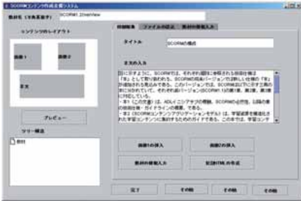
図5：システムのインタフェース

タイム環境を構成する要素は、API (Application Program Interface) とデータモデルである。API には、LMS にコンテンツが終了したのか中断したのかなどの進捗状況等のコンテンツの状態を伝えるための関数と、LMS-SCO 間でデータをやり取りするための関数、エラー用関数があり、これらは LMS-SCO 間のデータ通信に用いられる。また、データモデルとは、API のデータ通信関数で用いられる SCORM で規定されたデータ要素である。データモデルをデータ通信関数に用いることで、LMS から SCO が特定のデータを取得して学習コンテンツに反映し、逆に SCO から LMS へデータを設定することができる。