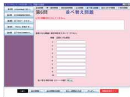
図6：システムのインタフェース

本システムを利用して作成したコンテンツが、実際に SCORM に対応した LMS 上で SCORM コンテンツとして正しく動作することを確認した。