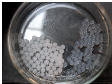
図3 固定化前のアルギン酸ゲルビーズ

種々の固定化法および担体を検討したが、赤色色素および色素生産細菌の固定化にアルギン酸ゲルビーズ (図3) が有用であることが分かった。アルギン酸ゲル中に色素を固定化し、 Heterosigma akashiwo 培養液に添加したところ、細胞数の減少が見られた。