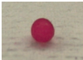
図5 色素細菌固定化アルギン酸ゲルビーズ (セルロース添加あり)