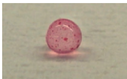
図4 色素細菌固定化アルギン酸ゲルビーズ (セルロース添加なし)

繰り返し利用可能な赤潮抑制材を目的に色素生産細菌を固定化したところ、数日間の培養の後、色素生産が確認された (図4、ゲルビーズが赤色に着色した) が、赤潮プランクトン懸濁液に添加したところ、プランクトンの増殖抑制は十分ではなかった。そこで、色素細菌の培養の際、セルロースを添加し、セルロースが混合された状態で固定化したビーズ (図5) を作製した。このビーズではより多くの色素が生産されていると考えられ、プ