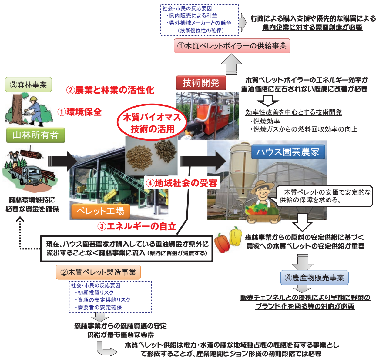
Fig. 1 地方の自立・持続可能な地域社会「地域経営システム」の構築

これらの技術開発により、木質バイオマスによる産業振興と事業形成がより安定的に成立する条件を確立したことになる。つまり、経済・環境面での優位性が示されると同時に、地域内での循環型エネルギー生産・消費システムの構築を可能にし、木質バイオマスによる地域経営システムの構築の可能性を見出すことが出来たことになる。技