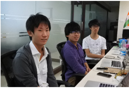
図 4. ネクストリーマー社の実習様子