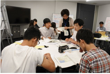
図 1. チームでの検討スタート