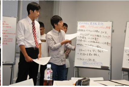
図 2. 各チームの発表