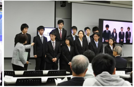
図 6. 本学報告会の様子 (10/26)

ぶべきところがあり、本当に勉強になった。」(システム工学群3年、AK)など、教えて頂いた知識に加えて、自分なりに試行錯誤しながら学んだことが、きっと彼らの自信に繋がるだろうと感じた次第である。