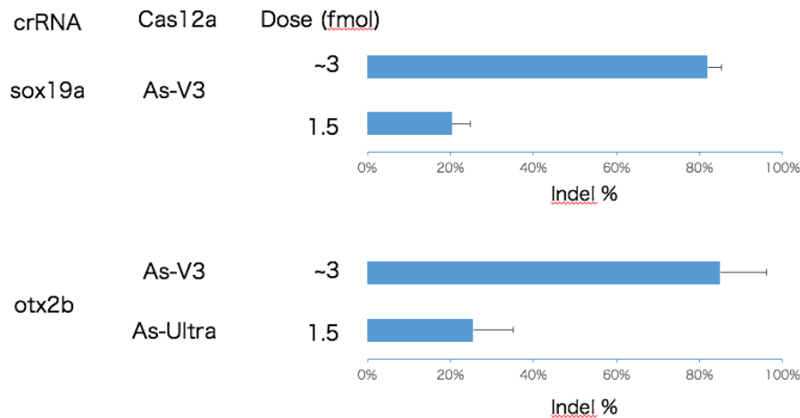
図 2.RNA 量に依存した切断効率の変化

上パネルが sox19a における AsCas12a-V3 RNP 複合体の液量を増やした顕微注入の結果であり、液量を増やしたことにより大幅な indel が生じた割合の増加が見られる。